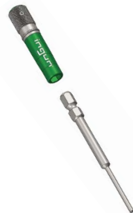
Beispiel: DW-1-S mit BIT-GKS-075 M-B