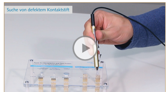
Den Einsatz des Ziehwerkzeugs sehen Sie als Video auf unserer Homepage.

Für weitere Informationen setzen Sie sich bitte mit uns in Verbindung. Preise und Lieferzeiten auf Anfrage. Technische Änderungen vorbehalten.